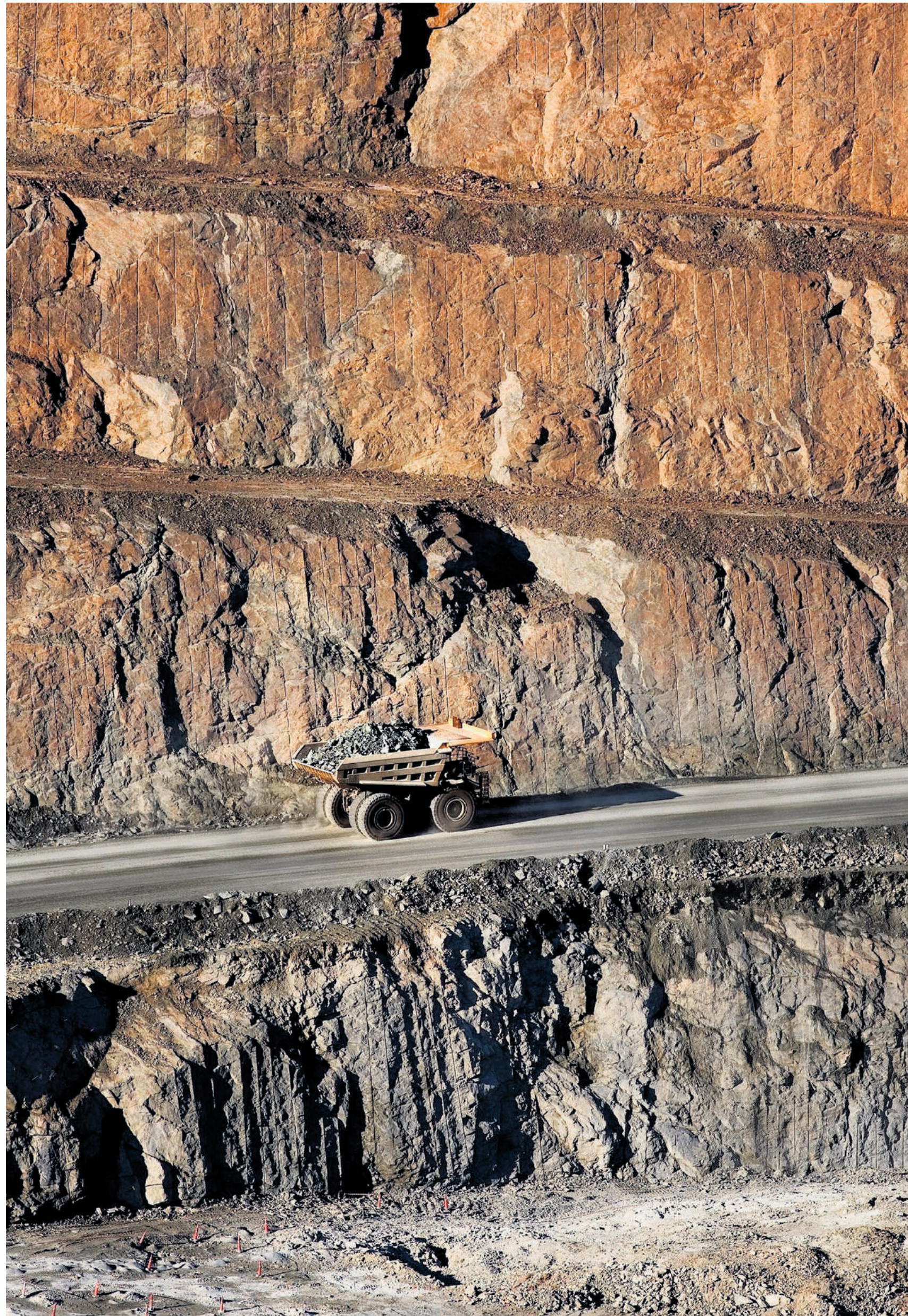
Vrijwel elke dag wordt een voetbalveld of groter in de open mijn 'Super Pit' in Kalgoorlie weggeblazen, zodat men het goud uit het puin kan winnen.

De Gwalia Deeps is zo'n gereanimeerde mijn. Tot in de jaren zestig van de vorige eeuw was Gwalia een levendig mijnwerkersdorp, met sportclubs, zwembad en elke week wel een feest. Toen de goudmijn sloot, zoals in de